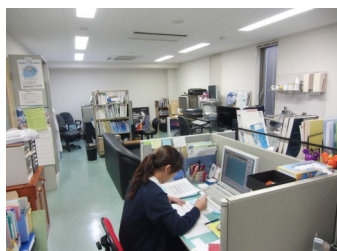
医師控室 医療秘書が診療のお手伝いをさせていただきます。

進化し続ける高度先進医療技術(機器)を、少しでも地域に活かしたい。 高度な診断・検査機能の提供を目指しております。