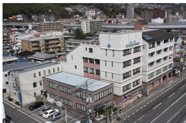
病院全景 広島市西部地区唯一 脳卒中 地域中核病院